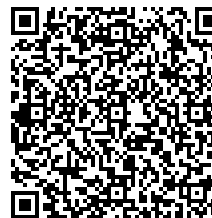
QR Code de validação

Empresa: JORNAL A HORA LTDA CNPJ: 26.663.972/0001-50 Data/Hora: 23/04/2026 08:00:59 Documento ID: 25086 Validação: https://horaitp.com.br/publicacoes-legais/?arquivo=25086&hash=9bf519468421782f008dc490bbc8411612a9d2d6 Hash SHA1: 9bf519468421782f008dc490bbc8411612a9d2d6